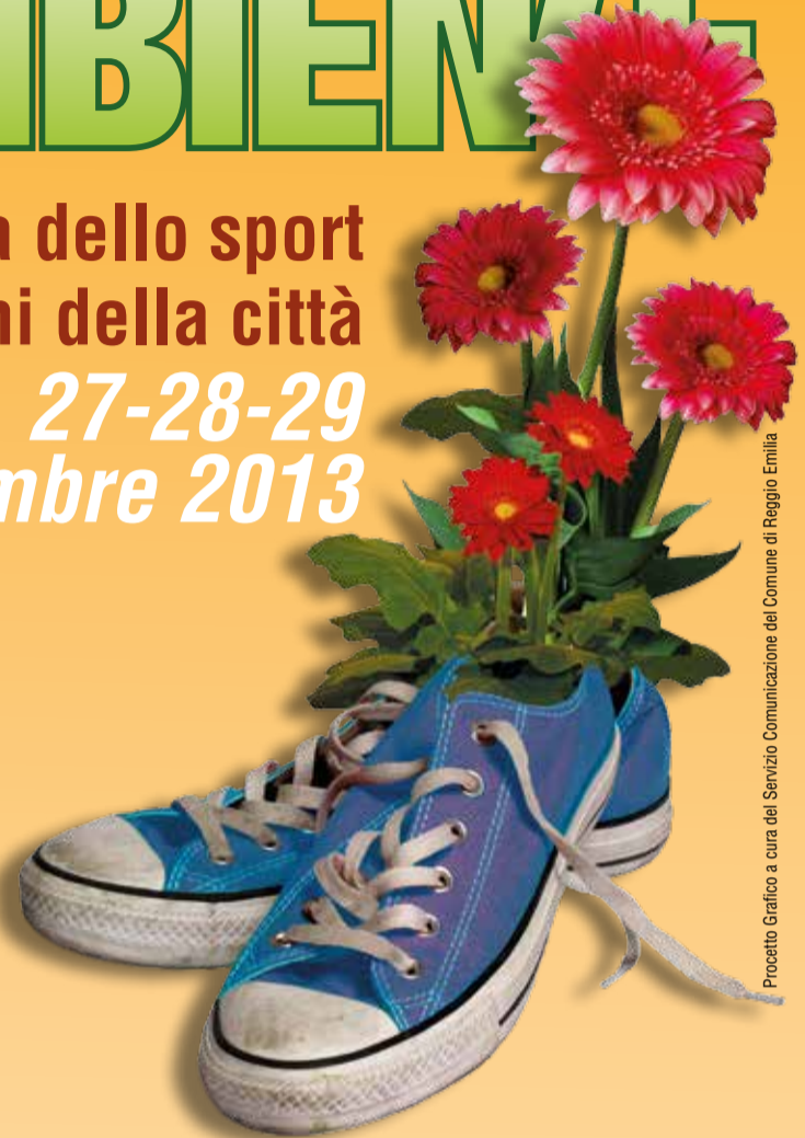
Prodotto Grafico a cura del Servizio Comunicazione del Comune di Reggio Emilia

Prima festa dello sport nei parchi della città 27-28-29 settembre 2013